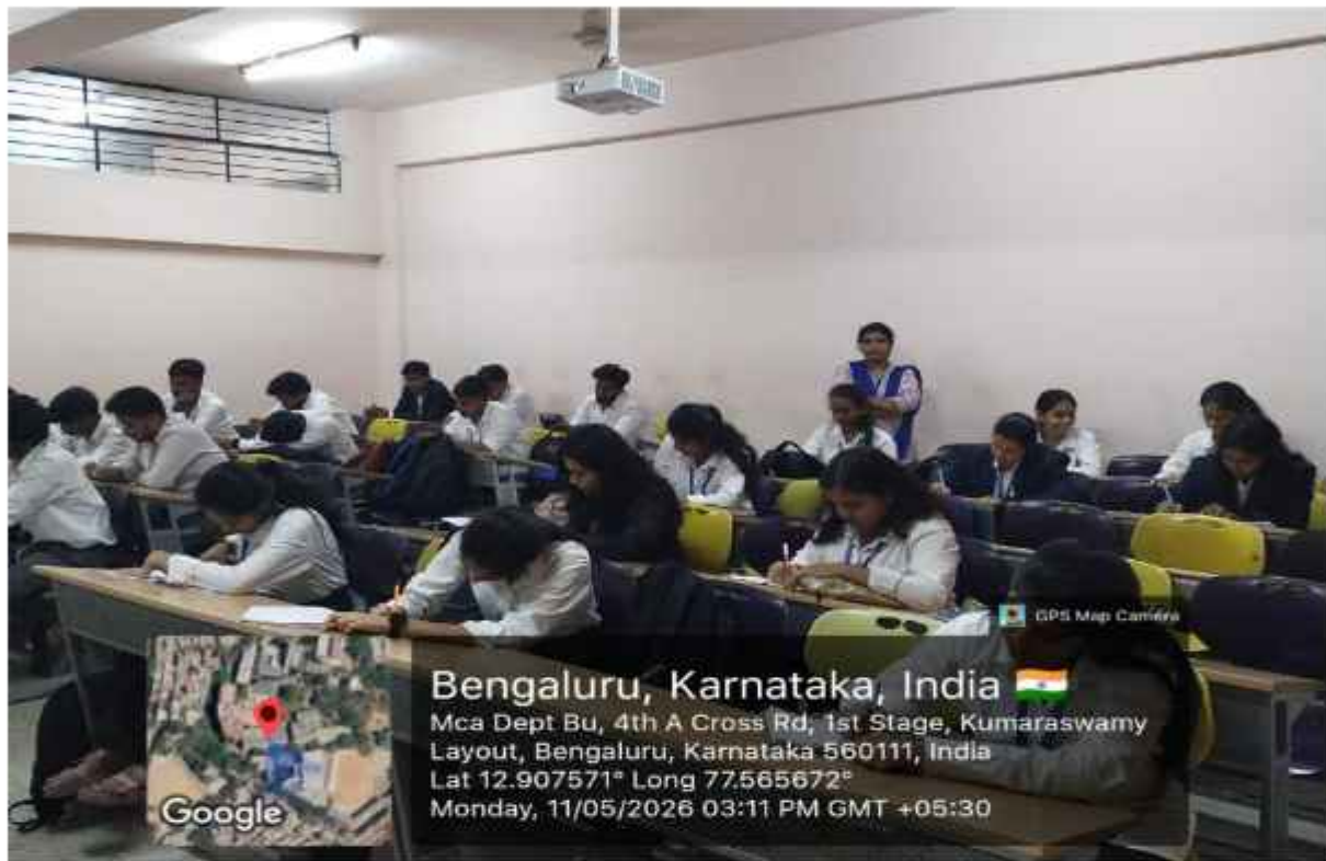
Photo-1. Class Room Photo