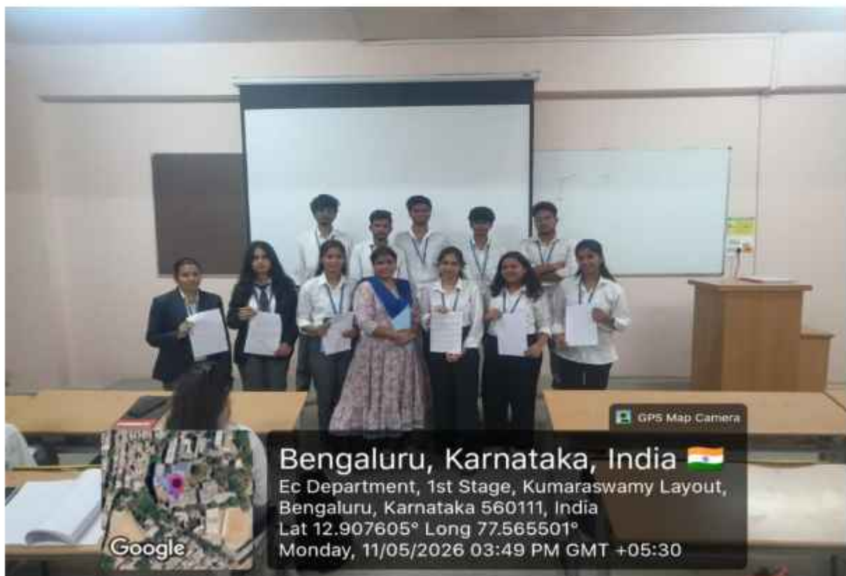
Photo-4 All participants